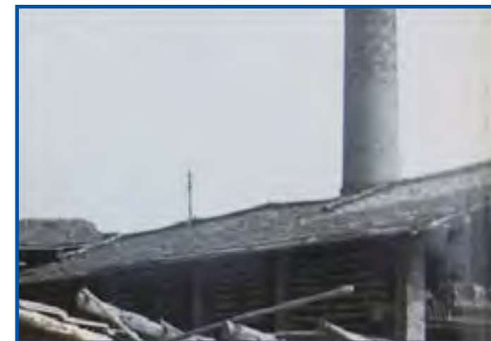
Fornace Anessi Flli 1954. Al primo piano le scalere per l'essiccazione delle tegole