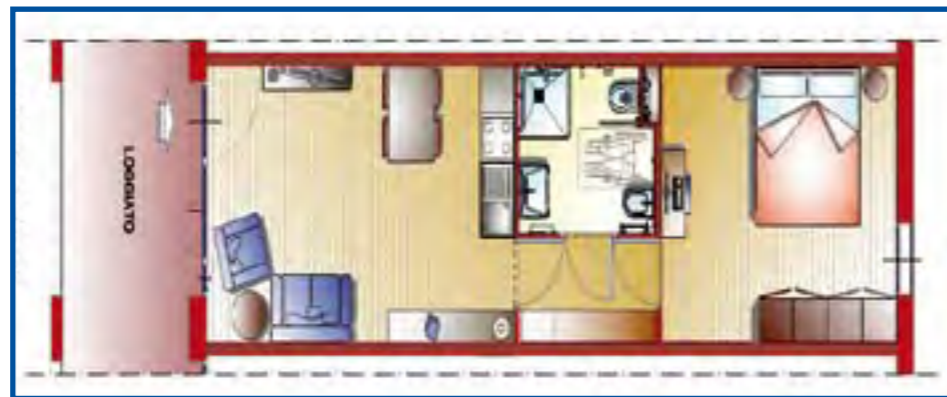
Pianta del bilocale

Il prezzo al mq della superficie commerciale (superficie dell'appartamento più quota degli spazi comuni, garage, cantina, ecc.) è molto contenuto, nonostante l'aumento deciso sulla base d'asta dopo che il 1° bando per l'assegnazione dei lavori è andato deserto: € 905 al mq tutto compreso (IVA, demolizione, costruzione, e costi tecnici come progettazione, direzione lavori, responsabile sicurezza). Un buon intervento per gli anziani di Corte Franca.