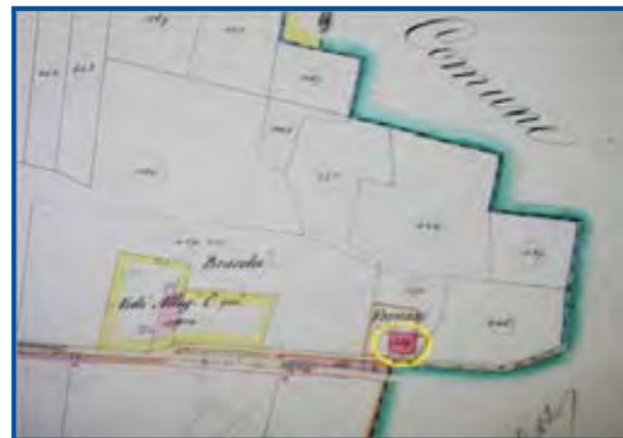
Catasto Austriaco 1853. La fornace di Borgonato in località Bracchi

I due volumi in via di pubblicazione assumono dunque, alla luce di quanto detto, un significato ancor più profondo: documentano, insieme al precedente, gli inizi, lo sviluppo, la scomparsa di un'attività produttiva che ha avuto un grande rilievo nella storia collettiva del paese.