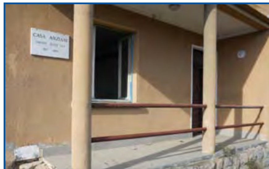
La casa di via Verdi oggi