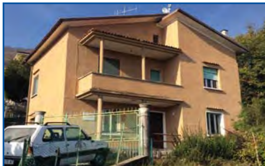
La casa di via Verdi oggi

Saranno presto realizzati 8 appartamenti per gli anziani del paese