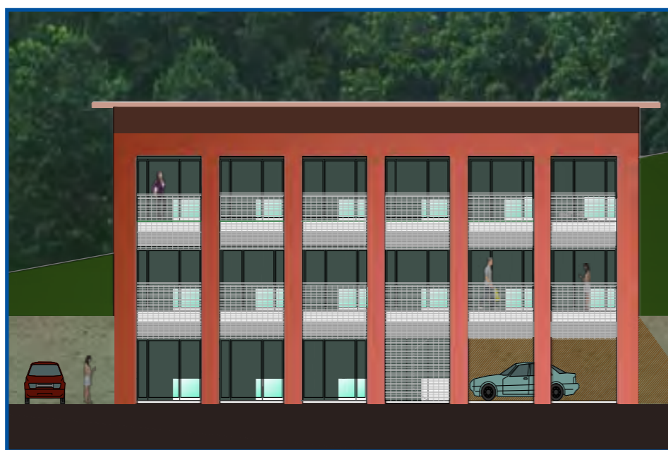
Vista frontale del nuovo edificio

Certo la scelta è politica: si ritiene importante rispondere a esigenze sociali, soddisfare i bisogni delle fasce deboli della comunità e fornire una risposta pubblica a un problema (quello dell'invecchiamento della popolazione) che non può che aggravarsi nei prossimi anni.